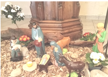
Crèches de la chapelle St Régis (ci-dessus) et de l'église de La Versanne (à droite)

Rencontre le 25 janvier de 9h à 11h30 à la maison paroissiale pour ceux qui désirent le baptême de leur enfant en mars et avril.